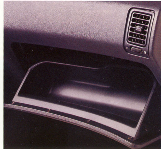
Boîte à gants