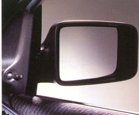
Rétroviseur réglable de l'intérieur