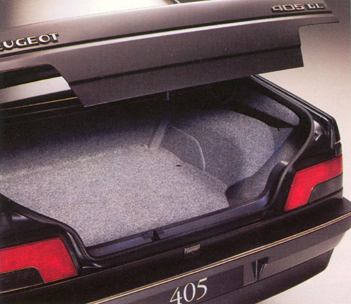
Coffre garni de moquette, avec éclairage