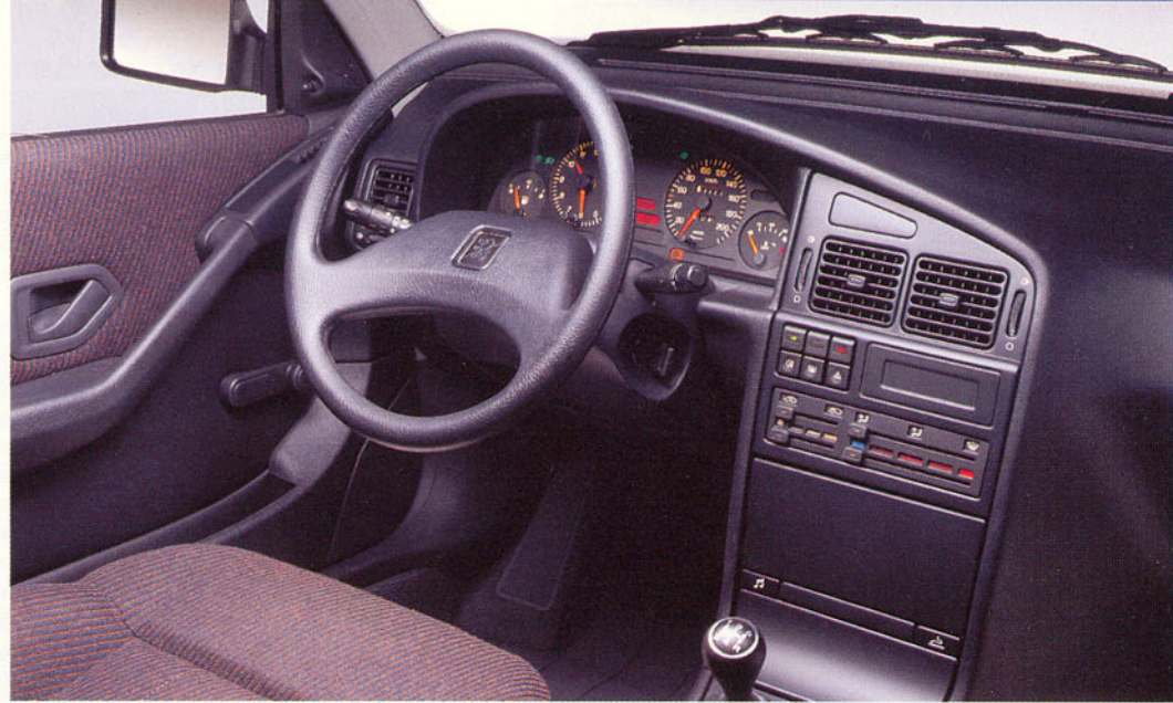
Poste de conduite