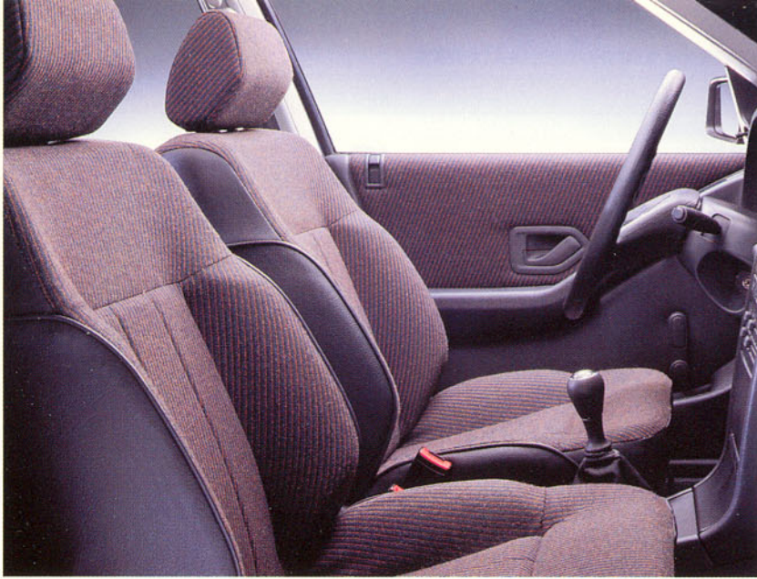
Sièges en drap